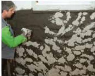
Aufbringen des KÖSTER Spritzbewurfs