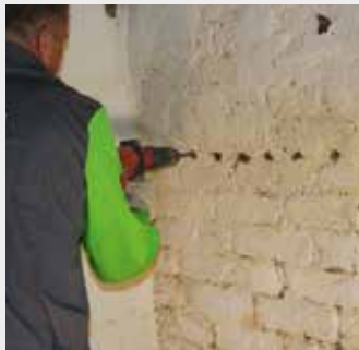
Waagerechte Bohrung in die Lagerfuge