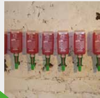
Selbständige Installation der Horizontalsperre