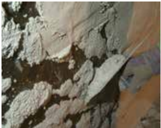
Aufbringen des KÖSTER Sanierputzes