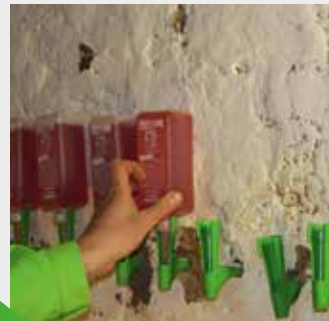
Einsetzen der Kartuschen