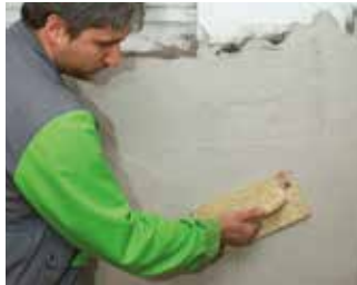
Abreiben der Oberfläche

KÖSTER Sanierputze sind in grau oder weiß erhältlich. Sie können, z. B. in historischen Gebäuden, als dekorativer Putz eingesetzt werden oder mit einer dampfdiffusionsoffenen Farbe überstrichen werden. KÖSTER Sanierputze sind für Innen- und Außenbereiche geeignet.