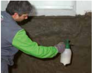
Grundieren mit KÖSTER Polysil TG 500

KÖSTER Sanierputze wurden eigens für die Instandsetzung von Mauerwerk mit hohem Salz- und Feuchtigkeitsgehalt entwickelt. Sie verhindern, dass Salze an die Oberfläche dringen. Wenn aufsteigende Feuchtigkeit mit KÖSTER Crisin 76 Konzentrat gestoppt wurde, helfen sie bei der Trocknung der Wand und bei der Aufnahme der Salze, die beim Trocknungsprozess auskristallisieren.