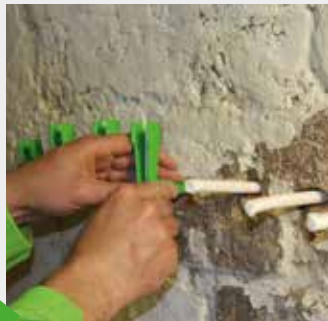
Einsetzen der KÖSTER Kapillarstäbchen und der KÖSTER Saugwinkel