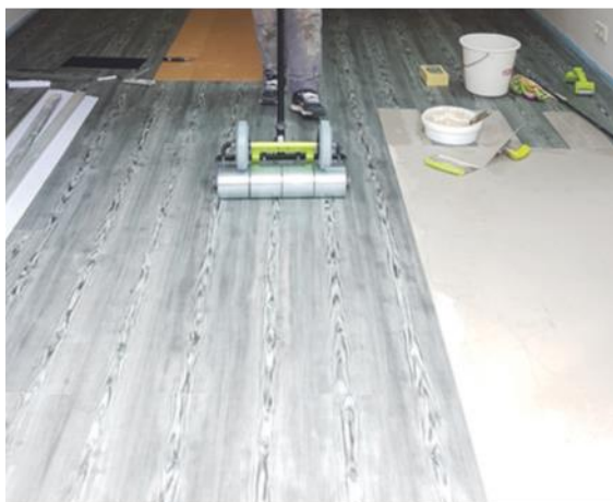
Verlegen von Designbelägen

Auf den folgenden Seiten finden Sie einen kurzen Einblick in unser umfangreiches und zertifiziertes Leistungsangebot.