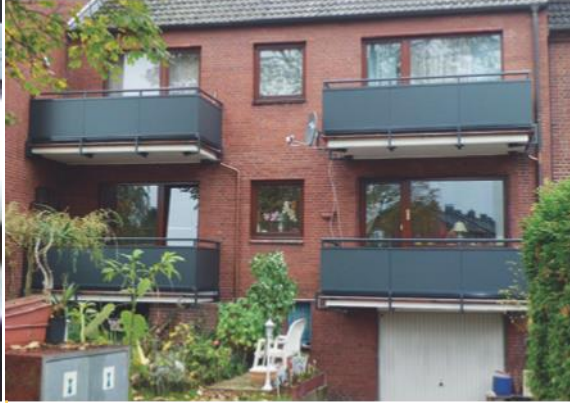
Balkonsanierung an einem Mehrfamilienhaus