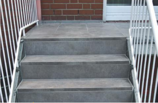
Treppe inkl. Fliesenarbeiten und Geländer