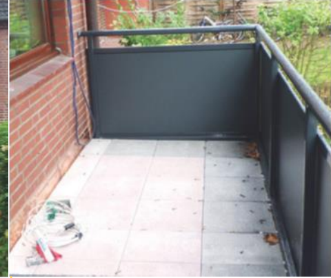
Schön und sicher