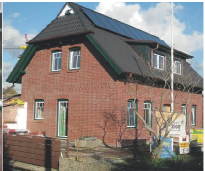
Firmensitz in Altengamme